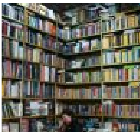
Bookcity Milano 2017: dal 16 al 19 novembre la letteratura...