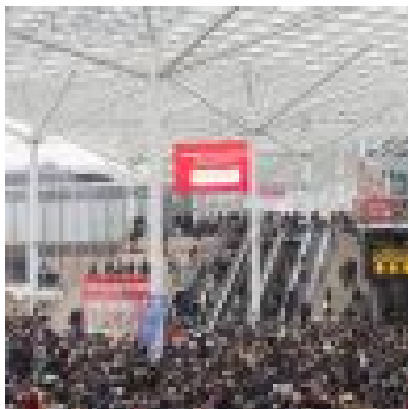
Fieramilano 2017, al via l'Artigiano in Fiera